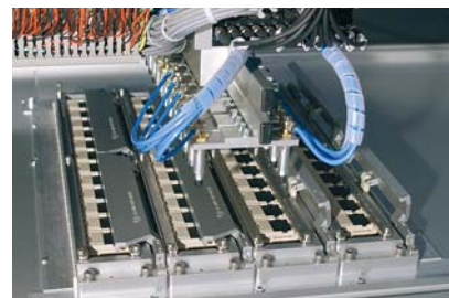
Detailaufnahme des Kartenkontaktfeldes mit 48 Kartenmulden für den Programmiervorgang.

Auswechselbare Kartenmulden für SD Card/MMC, RS-MMC oder microSD.