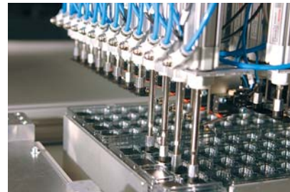
Speicherkarten-Transport durch Unterdruck