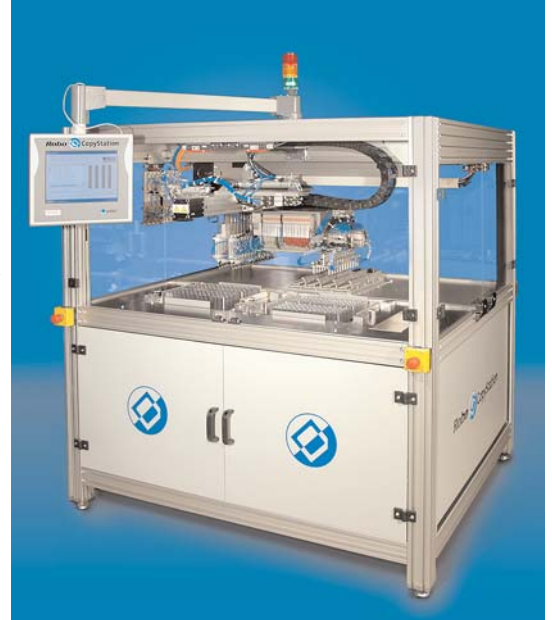
Robo CopyStation M2 Gesamtansicht